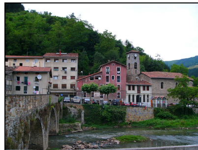
ZUBIA ETA ELIZA INGURUA